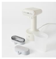
2種のアタッチメント付き