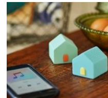
ワイヤレススピーカーハウス ¥3,600 (税抜)