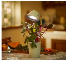
水耕栽培キット STAND BY GREEN ¥6,500 (税抜)