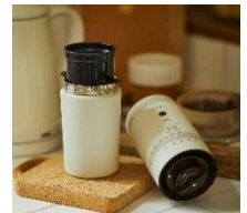
電動ミルクヒーメーカー ¥5,500 (税抜)