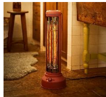
カーボンヒーター Nostal Stove wide ¥13,500 (税抜)