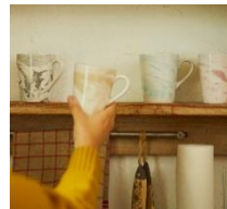
マーブルマグ ¥1,500 (税抜)