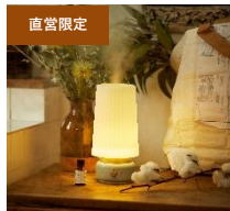
超音波アロマ加湿器 LAMP MIST ¥6,000 (税抜)