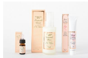
《ダマスクローズ スターターキット》

ダマスクローズ クレンジングミルク（125mL）、ダマスクローズ デューオイル（5mL）、 ダマスクローズ ハンドクリーム（35mL）、化粧品箱