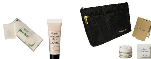
《① ¥5,000（税抜）以上対象ノベルティ》