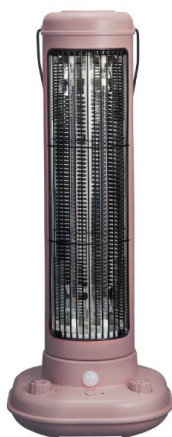
2018AW LIMITED アッシュピンク