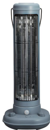
2018AW LIMITED アッシュブルー

人の動きを感知して自動でスイッチをON/OFFする人感センサーを搭載。 手間なく必要な時にだけ暖めてくれるので、電気代も節約できます。 柔らかなニュアンスカラーのボディとマットブラックに仕上げたメタルパーツが お部屋に上品で洗練された印象を与えます。