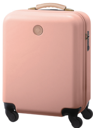
MILESTO UTILITY ハードキャリー キャビンサイズ(35L) パールピンク ¥26,000(税抜)

インテリア雑貨およびライフスタイル商品の企画/開発/販売を行う株式会社 イデアインターナショナル(本社:東京都港区、代表:森 正人)は、 “毎日を旅するように暮らす”大人のためのトラベルブランド「MILESTO(ミレスト)」にて展開しております、「MILESTO UTILITY(ミレストユーティリティ)」シリーズより 人気のハードキャリー キャビンサイズ(35L)の新色パールピンクを2017年7月上旬より新発売致します。