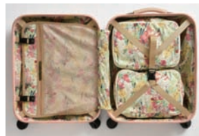
ウィットリーピンク