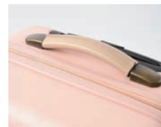
上質感のある本革の持ち手