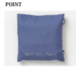
POINT 折りたんでコンパクトに