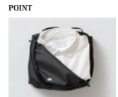
POINT インナーやトップス類の収納に