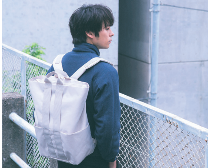
2016AW STLAKT series

インテリア雑貨およびライフスタイル商品の企画／開発／販売を行う株式会社 イデアインターナショナル（本社：東京都港区、代表：森 正人）は、 “毎日を旅するように暮らしたい”大人へ向けたトラベルブランド「MILESTO(ミレスト)」の機能的かつシンプルで人気の「STLAKT(ストラクト)」シリーズより 好評発売中のバックパックに小振りなMサイズと、使用感やディテールにまでこだわった収納アイテムを2016年7月下旬に発売致しました。