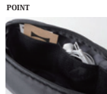
POINT 整理しやすい小分けポケット付き