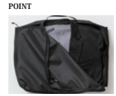
POINT スーツ・ボトムス類の収納に