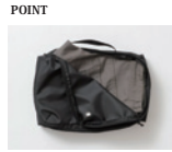
POINT トップス・ボトムス類の収納に