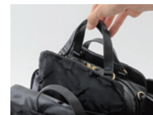
バッグインバッグとしても