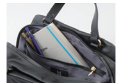
本やステーションナリーが収納可能