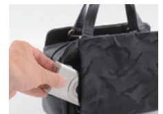
外側のファスナーポケット

縫製製品の為、サイズはおおよその値となります。商品ごとに柄の見え方が異なります。