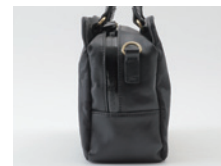
アシンメトリーなファスナー